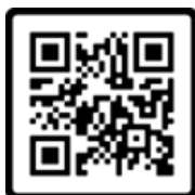
Figura 3 AD 6