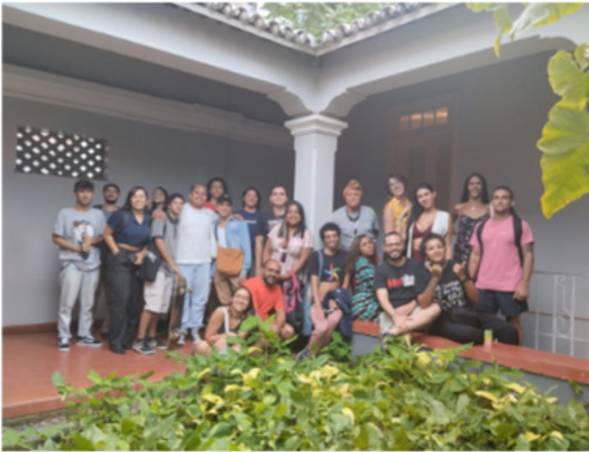
Figura 1: turma do programa Transpassando em aula de campo.