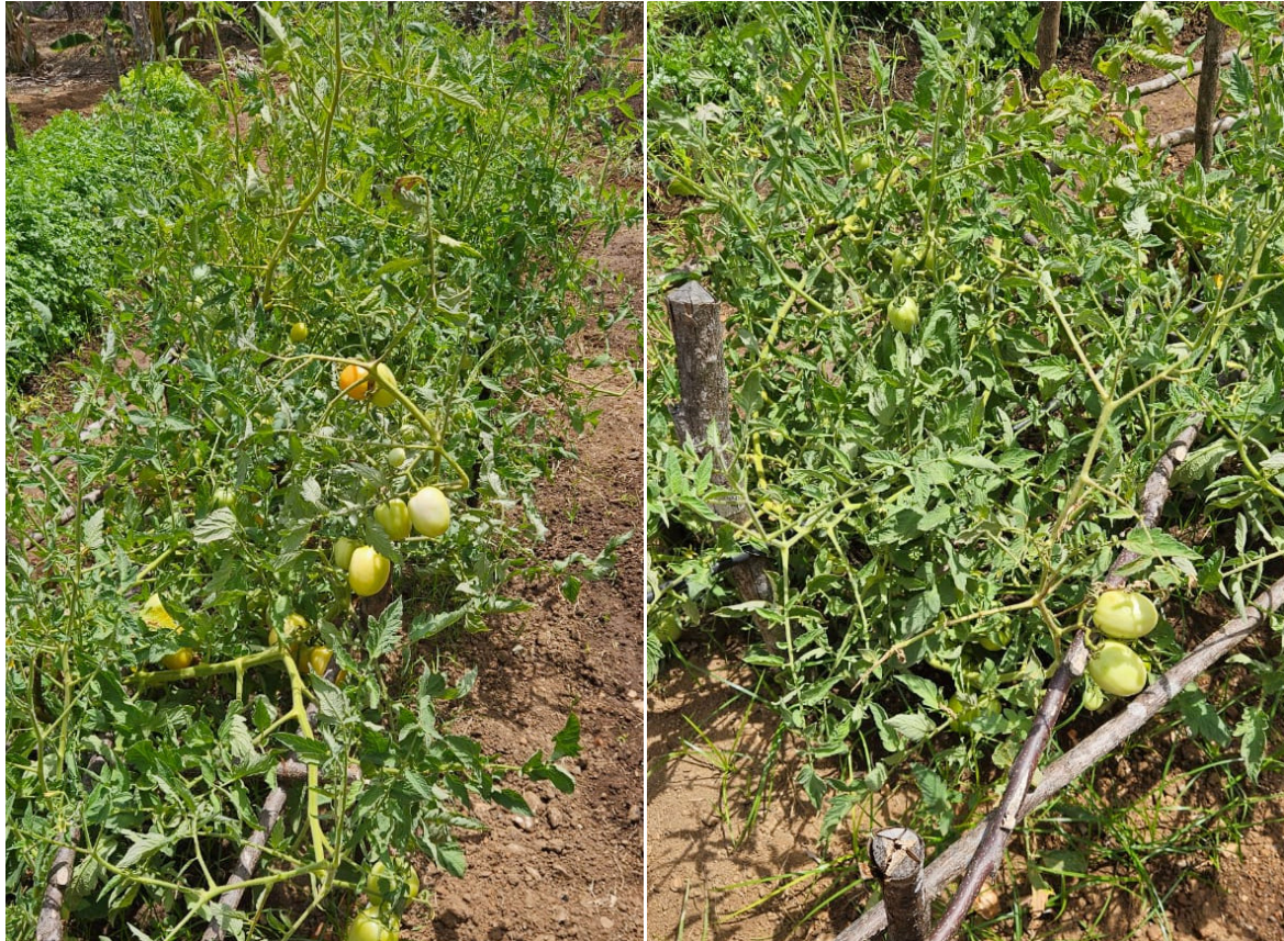
Figura 4 – Tomates plantados e produzindo ao final do experimento

Após o experimento ter sido encerrado os tomates provenientes do estudo foram plantados em canteiros da mandala na Escola de Ensino Médio Profissional do Campo João dos Santos de Oliveira (Figura 4) os quais foram utilizados para alimentação na própria escola.