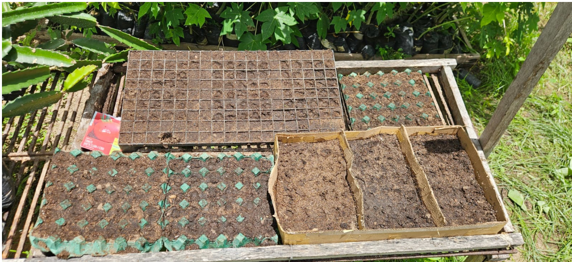
Figura 1 – Sementeiras utilizadas após a semeadura do tomate

Foram testados três tipos de sementeiras: convencional de plástico, bandeja de ovos e caixa de papelão reciclado (Figura 1). A sementeira convencional foi dividida em três seções, cada uma representando uma repetição. Foram utilizadas três bandejas de ovos, uma para cada repetição e embaixo foi colocado sua capa protetora de plástico. A caixa de papelão foi confeccionada artesanalmente, com três camadas de papelão na base e furos para drenagem de água. Ela foi dividida internamente para formar três compartimentos, correspondentes às três repetições.