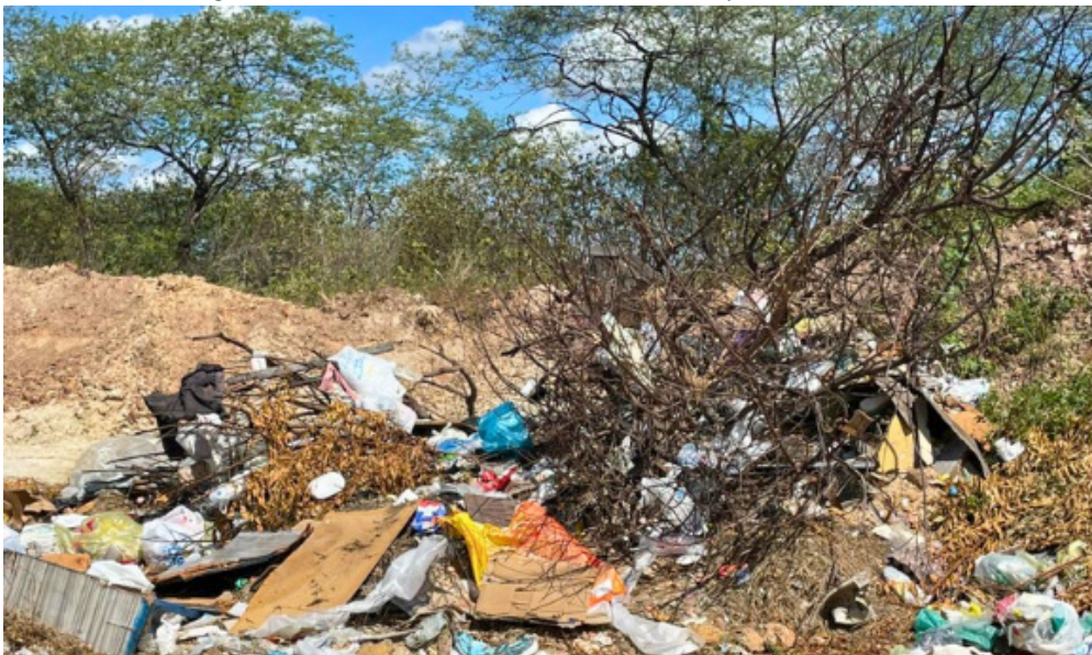
Figura 02: Descarte de resíduos em locais inadequados em 2025.

Numa aproximação concreta do locus investigado, também foi realizada aula de campo durante o turno da manhã, com a carga horária de 3 horas aulas intitulada "Minha casa, meu lugar: discurso sobre moradia e meio ambiente no Residencial Rachel de Queiroz", a fim de observar o bairro, com atenção voltada aos aspectos ambientais (resíduos, saneamento, área verde). Vale ressaltar, a importância das aulas de campo como uma das atividades didáticos-pedagógicas, realizadas com estudantes de um ou mais componentes curriculares, sob a orientação de docente(s), visando a aprendizagem de um objeto de conhecimento, cuja complexidade exige o contato direto com o contexto vivido. A seguir alguns registros que evidenciam problemas ambientais no bairro.