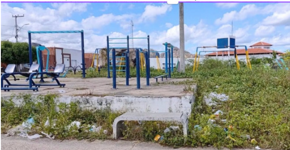
Figura 03: Academia ao ar livre, sem manutenção em 2025.